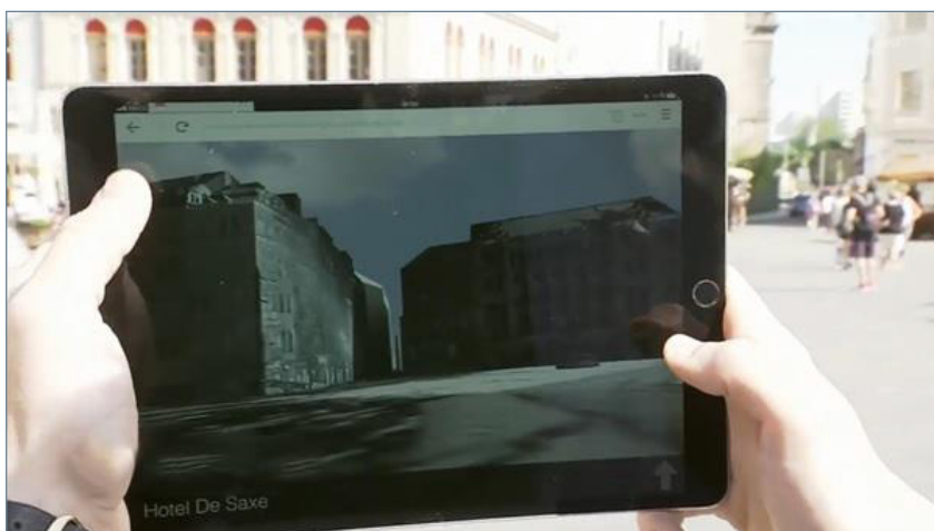
2. ábra: 4DCity-megjelenítő Drezdában 30

A forgatókönyv keretén belül készült egy 4D-Viewer (4D-megjelenítő), a 4DCity, 28 ami történelmi városok időben változó virtuális 3D-s lenyomatait teszi vizuálisan elérhetővé asztali és mobil eszközökön, valamint AR- és VR-szemüvegeken keresztül. Továbbá a Drezdai Műszaki Egyetem és a Würzburgi Julius-Maximilians Egyetem együttműködésében kifejlesztettek egy eszközt, a 4D-Browser-t 29 (4D-Böngésző), amelynek célja, hogy Drezda városának digitális 3D-modelljeit 1500 történelmi fotóval gazdagítsák, és kiegészítsék a lerombolt vagy megjelenésében megváltozott épületek 3D-s modelljeivel. Egy hozzáadott idővonal segítségével négy dimenzióban mutatja be a várost és a város építészeti fejlődését. Az általános online fényképatadtbázisokkal ellentétben a 4D-Browser innovatív és interaktív hozzáférést kínál a történelmi fényképekhez, lehetővé téve a felhasználók számára, hogy térben és időben keressenek a fotók között.