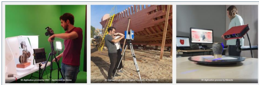
4. ábra: 3D-modellezés az EUreka3D projekt keretében 36

„Az EUreka3D projekt ... lehetővé teszi olyan fejlettebb gyűjtemények létrehozását, amelyek nemcsak a kulturális tárgyakat, hanem a hozzájuk kapcsolódó történetet és emlékeket is reprezentálják.”