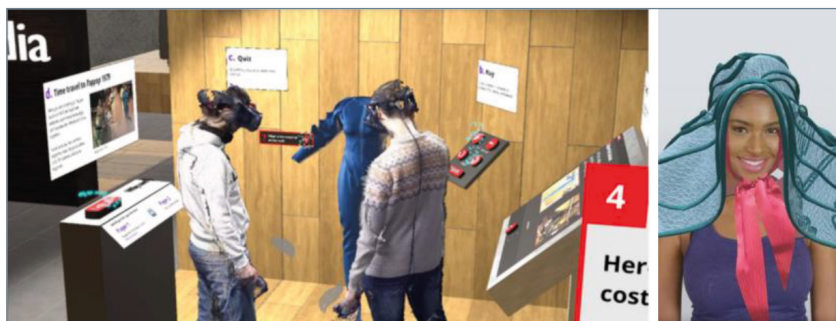
1. ábra: 3D-s divatkollekció a közösségi VR-ban & virtuális próbafülke 21

1.1. Divatörökséget tartalmazó gyűjteményekkel kapcsolatos nagyobb élmény megteremtése érdekében két kísérleti projektet is építenek, az egyik egy AR-technológiát használó webes alkalmazás, aminek használatával lehetőség lesz az Utrechti Központi Museum (Centraal Museum Utrecht) kalapgyűjteményét „felpróbálni” egy virtuális próbafülkében . 19 A másik pedig egy olyan webalkalmazás, amely VR-technológiát használva különböző kulturális intézmények divatgyűjteményeiből épít egy virtuális kiállítást . 20