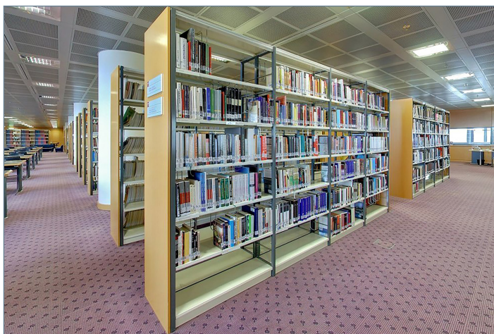
3. ábra: Könyvtárrészlet