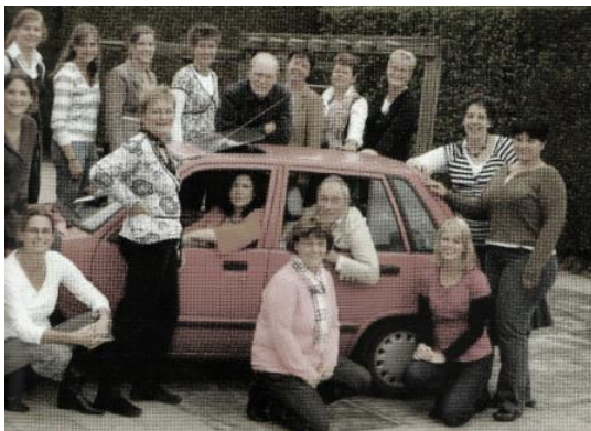
1. ábra A tanári team Voorthuisenben

Hollandia területe 41 526 km 2 , lakossága 16 500 000 fő, népsűrűsége 397 fő/km 2 , és 12 tartományra tagolódik. Államformája 1815-ben lett alkotmányos monarchia, és 1848 óta parlamentáris demokrácia. A holland parlament tekintélyes befolyással rendelkező része, az Alsóház (Tweede Kamer), amelynek 150 tagját négyévente választják meg.