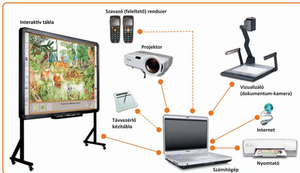
3. ábra: Az IKT eszközök http://raabe.hu/wp-content/uploads/2016/06/2015juni16_18ikt.jpg (2017 március 15.)

Az IKT- val támogatott módszerek a pedagógus és diák számára is azonnali visszajelzést ad, támogatja a tanulók egyéni tanulási stratégiáinak kialakulását, növeli az aktivitásukat, motivációjukat a tanórán.