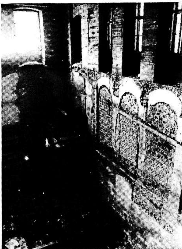
2. ábra A rekonstrukció 1. szakasza