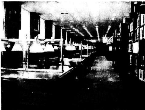
4. ábra Könyv olvasó

mondva: amelyek fölött) a katalógushálózat nyer elhelyezést. Az olvasóterem 146 olvasó befogadására alkalmas, 6 kutatófülke is lesz. Itt helyezkedik el a kézikönyvtár mintegy 15 ezer kötete is. Szabad polconkon, ill. rekeszes tárolókban mintegy 17 ezer könyv és 2500-féle folyóirat helyezhető el" [19].