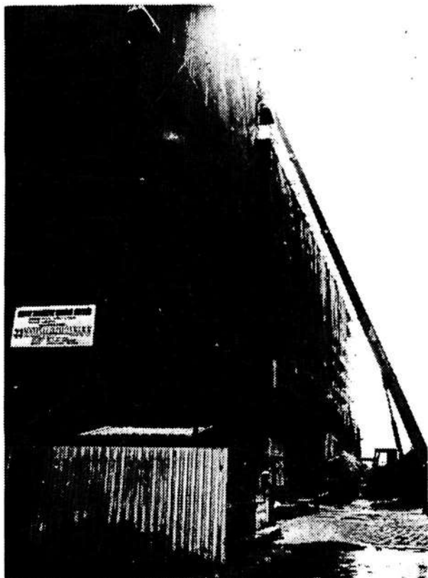
1. ábra A rekonstrukció kezdete