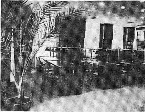
5. ábra Folyóirat-olvasó