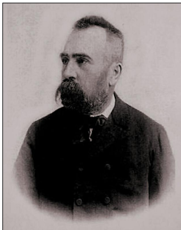
1. ábra Findura Imre (1844–1930)

ra nyilvános könyvtárat és térképgyűjteményt tart fenn. E végből a nyomtatók, illetőleg kiadók a nyomdatermékekből statisztikai célokra egy példányt a m. kir. Központi Statisztikai Hivatalnak ingyen beszolgáltatni tartoznak”. Miután a törvény a magyar fennhatóság alá tartozó összes területet érintette, Horvát-Szlavóniából is érkeztek anyagok.