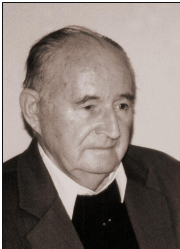
3. ábra Kovacsics József (1919–2003)

Gombás Géza eltávolítása után újabb átmeneti időszak következett, amelyről szinte egyáltalán nem áll rendelkezésünkre forrás. Az új korszakot Kovacsics József (3. ábra) 1954-es vezetői kinevezése hozta el.