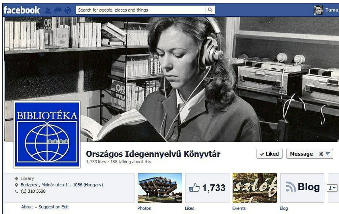
2. ábra Az OIK Facebook oldalának nyitóképe

Az Országos Idegennyelvű Könyvtárhoz jelenleg három Facebook oldal köthető. Egy általános, a teljes intézményt reprezentáló oldal [6], egy Zeneműtári Facebook oldal [7], amelyen zenei hírek, események, képek jelennek meg, és egy eszperantó témájú oldal [8], melyet a Fajszai Gyűjtemény gondoz. A továbbiakban a könyvtár általános oldaláról lesz szó.