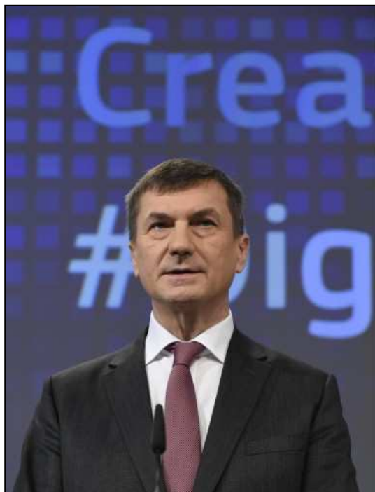
Andrus Ansip

– Hogyan tesznek különbséget az egyedi és a már megosztott tartalom között? Hogyan lehet meghatározni, mi egy adott téma alapforrása, ami után majd fizetni kell a szolgáltatóknak?