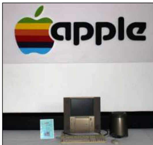
2037 A 20. születésnapra készített TAM gép