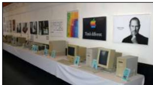
1958 Részlet a kiállításból