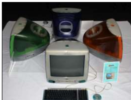
2034 iMac G3 számítógépek