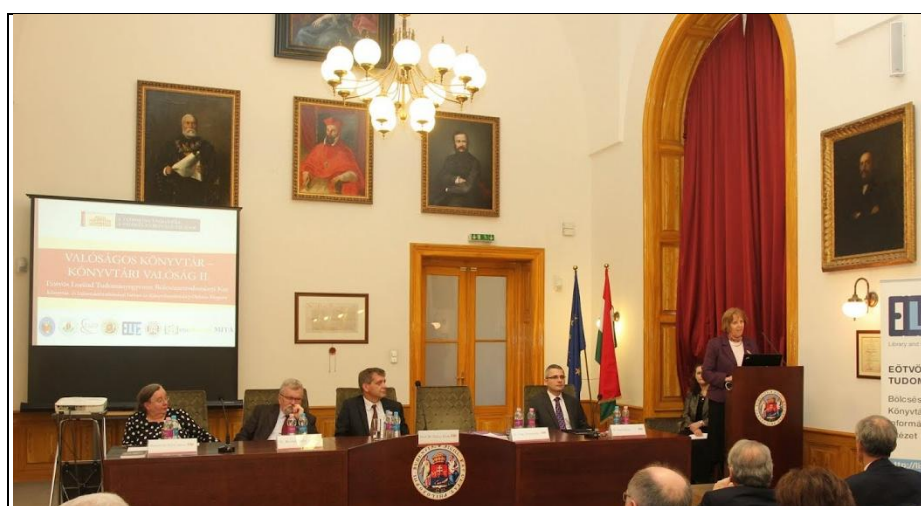
A konferencia megnyitója 1.

https://photos.google.com/share/AF1QipPwsudVj2JQT2y_GffJgwoJ8GtrZP9nJVpYDjN7P-fX1zXhE-LiozrUcBQkcXq3Tg/photo/AF1QipNYZ0iU55XSzN8rFWewgDGpN_GRdmyCAOgbm1Y?key=UI9Vc0s3UWVKQWhHaWI5di96X1FaQ0hocE5UbURR