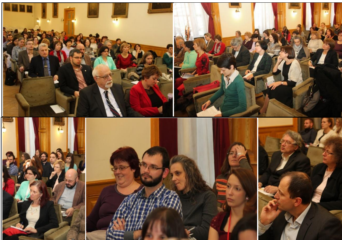
A konferencia közönsége

https://photos.google.com/share/AF1QipPwsudVj2JQT2y_GffJgwoJ8GtrZP9nJVpYDjN7P-fX1zXhE-LiozrUcBQkcXq3Tg/photo/AF1QipOzkAiqdbXJXeIB0wNfh8tUUZFnbLaG4_XXwoE?key=UI9Vc0s3UWVKQWhHaWI5dl96X1FaQ0hocE5UbURR