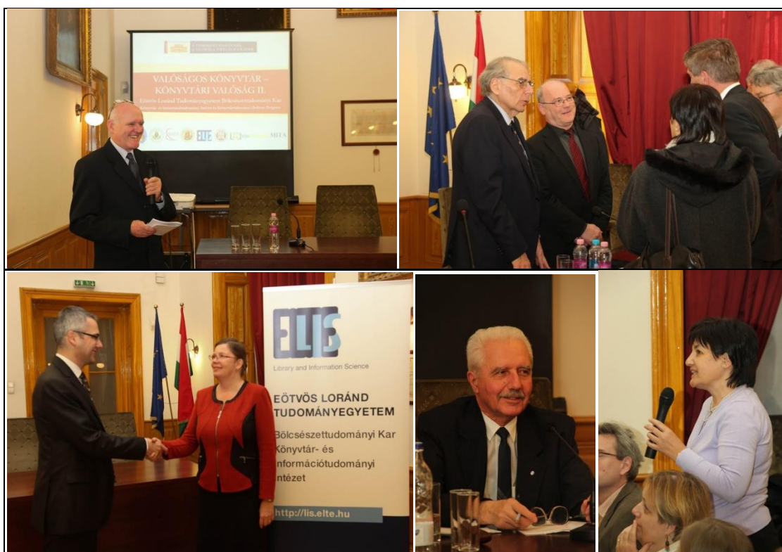
Pillanatképek a konferenciáról

https://photos.google.com/share/AF1QipPwsudVj2JQT2y_GffJgwoJ8GtrZP9nJVpYDjN7P-fX1zXhE-LiozrUcBQkcXq3Tg/photo/AF1QipMnLEcEc14e3KPRHO4rQLJ4vsxXcdRavS5NYdQ?key=UI9Vc0s3UWVKQWhHaWI5dl96X1FaQ0hocE5UbURR