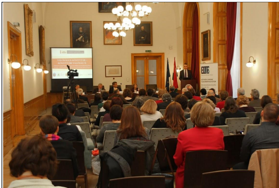
A konferencia megnyitója 2.