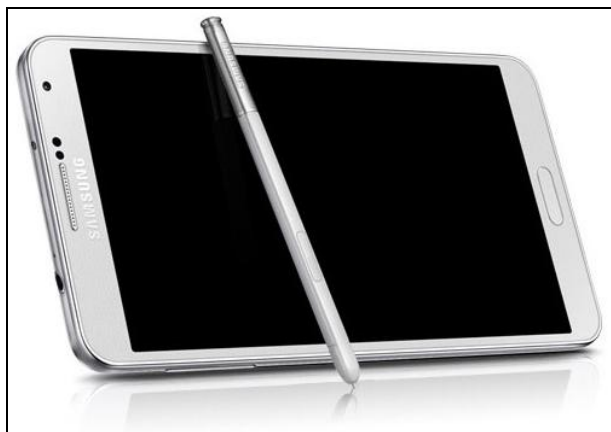
2. ábra A Samsung Galaxy Note 3 stylussal ( http://images.intomobile.com/wp-content/uploads/2013/10/galaxy-note3.jpg )

A phablet kifejezés a phone és a tablet szavak összevonásából alakult ki, ami nagyon ötletes megoldás, hiszen így kifejezi a készülék elemi tulajdonságát. Mérete jellemzően öt és hét col közötti, éppen kitöltve az okostelefonok és tabletek közötti űrt. Alapvető, hogy lehessen velük telefonálni, ha ez a tulajdonság hiányzik, akkor inkább egy kisméretű tabletről beszélhetünk, mint phabletről. A tabletek oldaláról a kényelmes tartalom- és multimédia-fogyasztási képességeket hozta. Párhuzamként érdemes még megemlíteni az e-könyv-olvasókkal való méretbeli hasonlóságot, mivel a sztenderd e-könyv-olvasók mind 6 colosak, ami éppen a phablet kategória közepét jelenti. Ebből következik, hogy bizony ezek az eszközök már digitális könyv-olvasásra is gond nélkül használhatók. Szintén fontos kiemelni az újra felfedezett stylust ennél az eszköztípusnál, ami akár a kézzel történő jegyzetelést is lehetővé teszi, a precízebb navigáció előnyeiről nem beszélve.