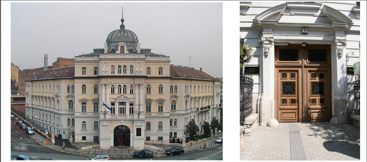
2. ábra A KSH Könyvtár épülete

A 2000-es évek elején az addig használt könyvtári rendszerről (TEXTAR) a könyvtár folyamatosan átállt az IQSoft forgalmazásában lévő OLIB 7.1 integrált rendszerre. 2004-től indult meg a rekatalógizálás, azaz a cédulakatalógus feldolgozása a számítógépes adatbázisba. [49]