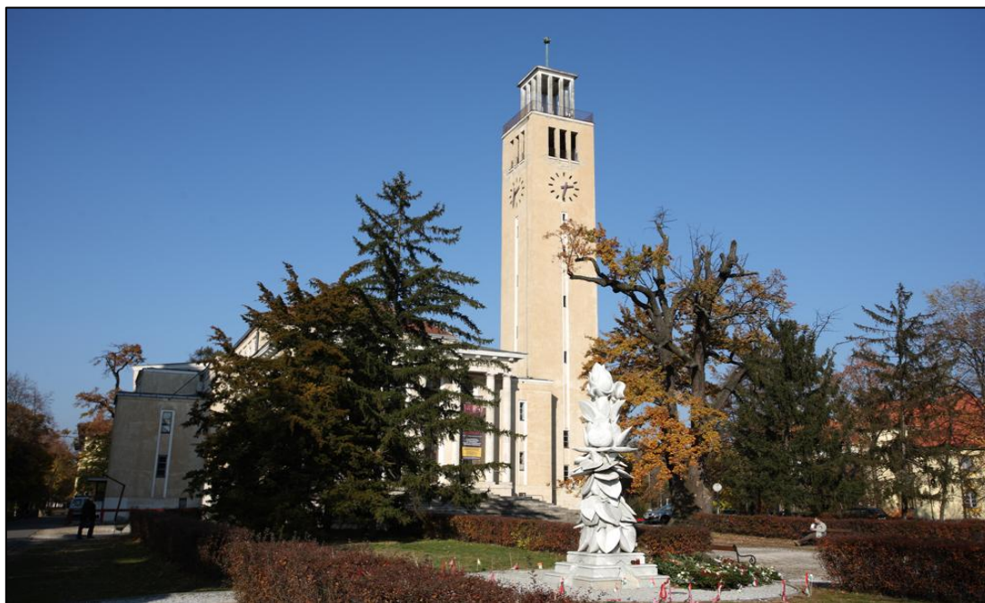
5. ábra Az egyetemi templom

Az önálló orvoskari könyvtár megalakításának érdekében is folyamatosan küzdöttek a kar képviselői, de tényleges létrehozására csak 1947-ben került sor, otthonra pedig egy évvel később lelt, a Kenézy Villában, ahol fokozatos terjeszkedéssel 1981-ben a teljes épületet elfoglalta és egészen 2005-ig működött (6. ábra). Már a 90-es évektől elindultak a tervezések egy 21. század elvárásainak megfelelő otthon kialakítására, ami aztán 15 esztendő alatt realizálódott, és az orvostudományi gyűjtemény méltó helyet kapott a jelenlegi épületben jelentősen bővülve a volt KLTE (Kossuth Lajos Tudományegyetem) kémiai és biológiai szakgyűjteményeivel (7. ábra).