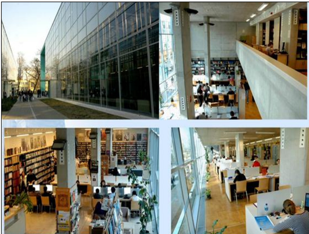
7. ábra A Kenézy Élettudományi Könyvtár mai otthona