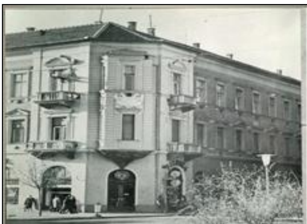
1. ábra Az Egyetemi Könyvtár első otthona