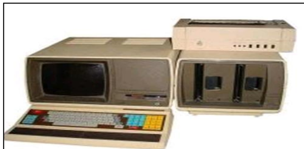
9. ábra Az első számítógép

A számítógéppel való könyvtári feldolgozó munkát és információszolgáltatást a könyvtárak már 1984-ben elkezdték. A katalogizálás az Unesco által ingyenesen rendelkezésre bocsátott Micro-Isis szoftverrel indult, míg a postától bérelt vonalon elkezdődött a rendszeres információkeresés a nagy közvetítő központokon keresztül, mint a DATA-STAR, DIALOG és STN International (9. ábra).