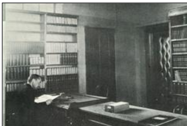
2. ábra A könyvtár olvasóterme

A megfelelő elhelyezés kivívásában elévülhetetlen szerepet játszott Nyíreő István , aki 1929-ben a kultuszminiszter, Klebelsberg Kuno utasítására megbízással érkezett Debrecenbe, hogy az egyetemi könyvtár igazgatója legyen. Nyíreő a folyamatban lévő Főépület építkezésének aktív részesevé vált, s ez az intézmény szempontjából sorsdöntőnek bizonyult. A könyvtárépítészeti és könyvtárszervezési kérdései felé nyitott igazgató Korb Flóris sal egyezettette a könyvtári igényeket, amelyeket az építkezés irányítója figyelembe is vett (3. ábra). Klebelsberg Kuno 1929-ben rögzítette az új könyvtár helyiségeinek Nyíreő által javasolt határozatát, s a költségek fedezéséről biztosította az egyetemi tanácsot. A kiváló műépítésszel egyetértésben Nyíreőnek sikerült a terveknek a korszerű könyvtárépítészeti elveknek megfelelő átalakítása és a könyvtári épületszárny megnagyobbítása, amely így 2 millió kötet és több száz olvasó befogadására lett alkalmas. (Ma közel 4 millió kötet helye.)