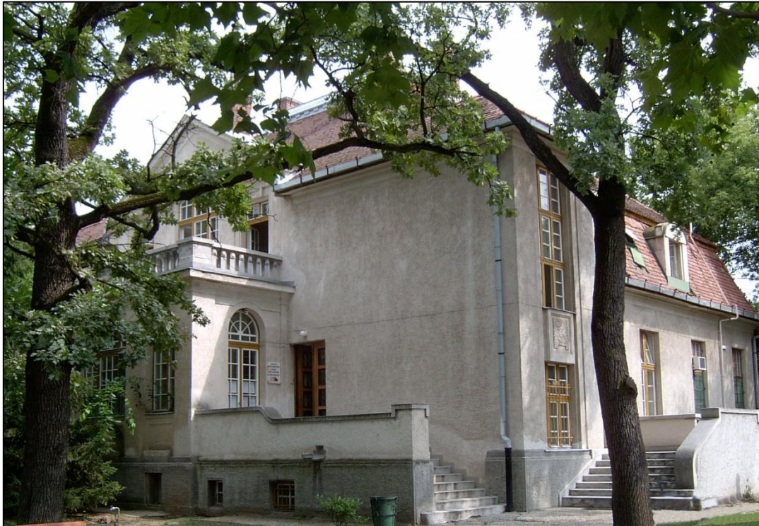
6. ábra A Kenézy Villa