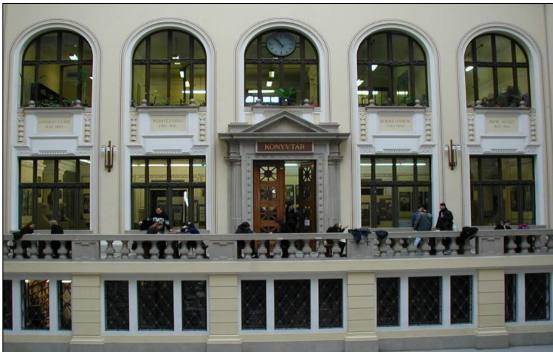
4. ábra A könyvtár homlokzata

járója az épület közepén lévő díszudvar felől van (4. ábra). A nyilvánosság számára szánt minden tágas helyisége észrevehetően hangsúlyozza tervezője alap gondolatát, hogy e könyvtárnak bárki számára könnyen hozzáférhető, és a komoly munka számára készült tudományos intézménynek kellett lennie.