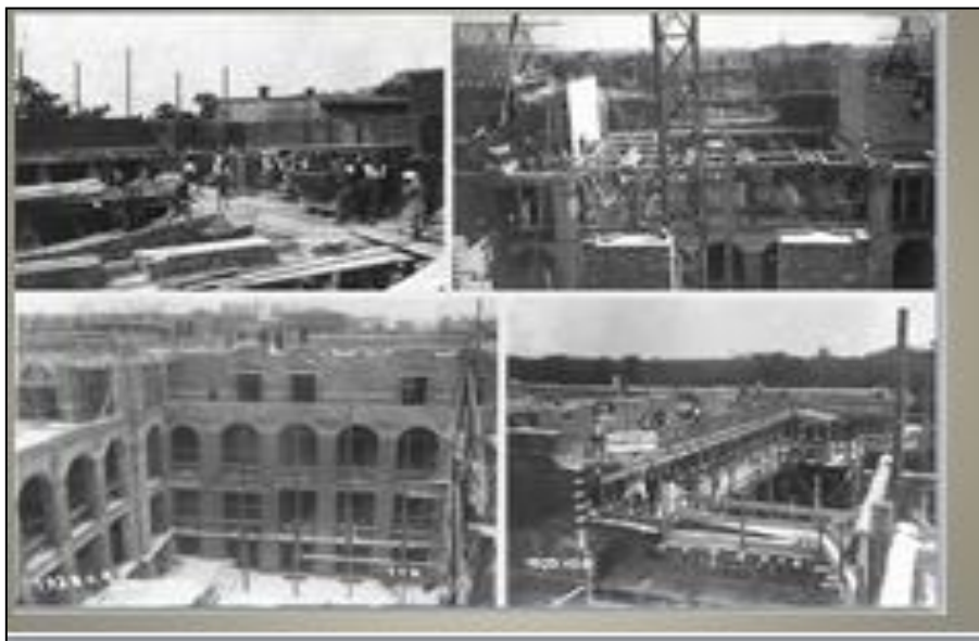
3. ábra Egyetemi építkezés, 1929.

Bár az oktatási egységek és a könyvtár egy épületben helyezkednek el, a könyvtár hetven méteres homlokzatú építménye eltérő céljai miatt a központi épület komplexumával szerkezetileg csak kevésbé függ össze, elhelyezése mégis elárulja azt a szoros viszonyt, amely az egyetem oktatási egységeihez kapcsolja. Monumentális kiképzésű főbe-