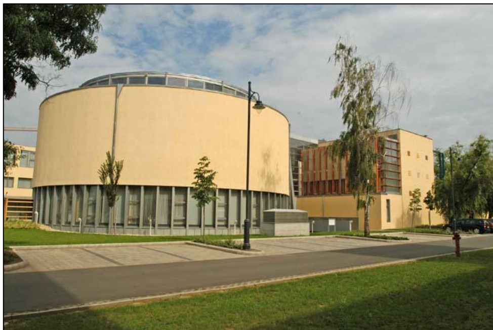
8. ábra A Társadalomtudományi Könyvtár épülete