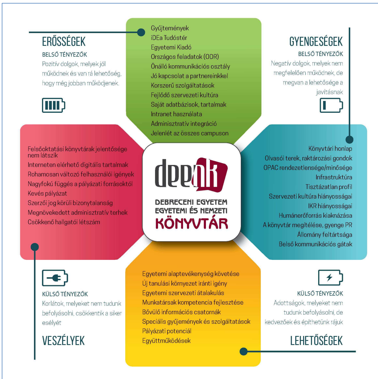
1. ábra DEENK SWOT 2016

Differenciáltan képzett munkaerőnk kompetenciáinak további fejlesztésével, a belső kommunikáció, valamint a szervezeti kultúra fejlesztésében rejlő lehetőségek kiaknázásával tovább erősíthetjük a felhasználó-központú szemléletet szolgáltatásaink tervezésében, szervezésében és közvetítésében. Kihasználjuk az egyre bővülő információs csatornákat és eszközöket, kapcsolódunk helyi, nemzeti és nemzetközi közösségekhez és szolgáltatásokhoz. Mindezt a speciális igényeket is kielégítő, személyre szabott funkciókkal tesszük emberközelivé.