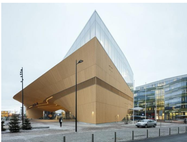
Oodi, Helsinki új könyvtára. Építész: ALA Architects.

hették meg. 2600 látogató 2400 véleménye érkezett be a kiállítás során. Nem a laikusok véleménye alapján választottak győztest, hanem szakértői zsűri mérlegelt: a közvélemény csak egy szempont volt a sok közül. A pályázat második fordulójában 6 pályamű került megmértetésre. A közönségszavazás ebben a fordulóban is hasonlóan zajlott. A közösségi folyamat fontos pozitív eredménye a kiíró szerint, hogy az építést érdeklődő figyelem és pozitív várakozás fogadta mindvégig, és részben ennek tudják be, hogy az eredetileg tervezett napi 10 000 látogató helyett 12–13 000 embert is számláltak már. Az új könyvtár közkedvelt hely.