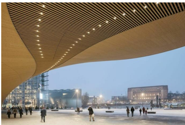
Oodi, Helsinki új könyvtára. Építész: ALA Architects.

Helsinki új központi könyvtára, vagy ahogyan a finnek nevezik az OODI a Parlament és Steven Holl Kiasma múzeumának közvetlen közelében áll a Kansalaistori téren. Szemben vele a Helsinki Music Center, kicsit arrébb Alvar Aalto Finlandia palotája áll, szellemi értelemben nagyon sűrű, fizikai értelemben egy tágas helyen.