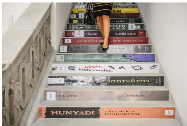
Lépcső az egri egykori Helyőrségi Művelődési Otthonban, a Bródy Sándor-könyvtár épületében. Mi lesz a következő lépés?