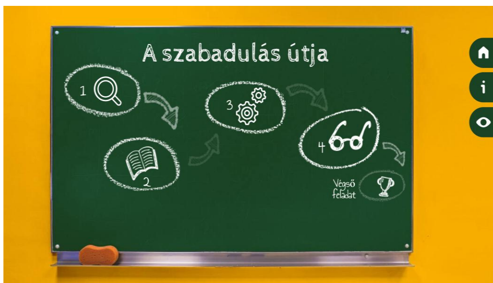
6. ábra A Berzsényi Dániel Megyei Hatókörű Városi Könyvtár online szabadulószoobájának nyitóképe

Összegzésül fokozottan felhívnom a figyelmet a KDS-ben kiemelt célra, hogy „a közgyűjtemények a kulturális örökség őrzőiből, a kulturális örökség első számú, autentikus, forrás értékű megosztóivá váljanak”. A közgyűjtemények az évek során komoly digitalizálási tapasztalatra tettek szert, a technikai fejlődéssel és használói szokások változásával ez ugyanakkor önmagában már kevés. A gyűjteményeknek egyszersmind professzionális tartalomszolgáltatóként is bizonyítaniuk kell, és a dokumentumkincseknek nemcsak őrzői lesznek, hanem azok tartalmának „újrahasznosításával” kreatív közvetítők is. A KDS könyvtári ágának tevékenységei ehhez kívántak segítséget nyújtani, ezt a folyamatot igyekeztek elősegíteni.