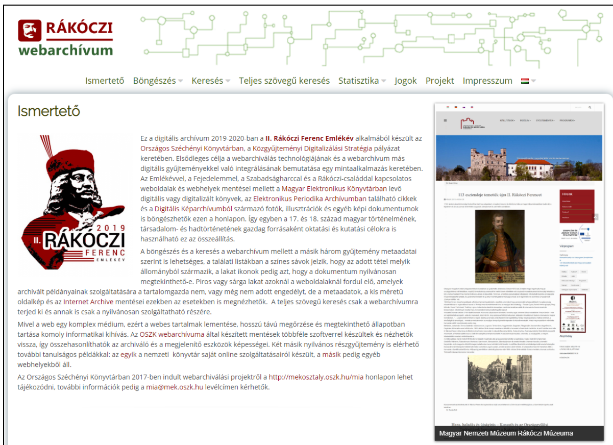
2. ábra A Rákóczi webarchívum nyitóoldala

A mérhetőség érdekében a sikeres pályázat feltétele minimum 10 000 új felvétel (oldal vagy oldal-párok leképezése) elkészítése és átadása az OSZK számára. A felvételek önmagukban azonban csak nehezen újrahasznosítható digitális adathalmot generáltak volna, ezért az egységesítés, és a későbbi felhasználás biztosítása érdekében meghatározásra kerültek a befogadásra alkalmas felvételek készítéséhez szükséges technikai feltételek 5 . A feltételek kidolgozásához a korábbiakban említett Fehér Könyv mellett a Federal Agencies Digital Guidelines Initiative (FADGI) ajánlásait vettük figyelembe. Emellett a sikeres teljesítés feltétele a digitalizálás során létrejövő tartalmak részletes szabványos formában (pl. Marc, DC) történő feltárása és a metaadatok továbbítása a felvételekkel. Ezek garantálják, hogy a létrejövő