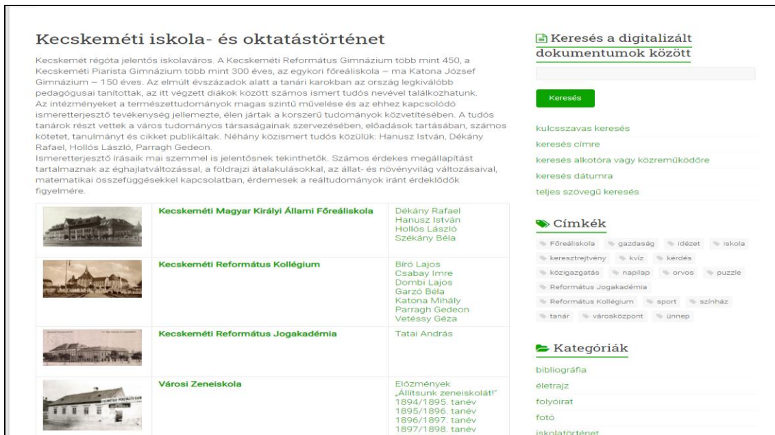
4. ábra A „Kecskeméti iskola- és oktatástörténet” tartalomszolgáltatás nyitóoldala

A szegedi Somogyi Károly Városi és Megyei Könyvtár Szeged 300 címmel készített virtuális kiállítást és mobilkészülékre is letölthető applikációt. Ez a könyvtár dokumentumainak segítségével 12 témakörre bontva ismerteti meg a várost az érdeklődőkkel 9 . Ezek a következők: A szabadsalomlevél; Az 1848-49-es szabadságharc Szegeden; A szegedi nagy árvíz; Az épülő Szeged; A millenniumi ünnepek és a századforduló Szegeden; Az első világháború; Szeged a két világháború között;