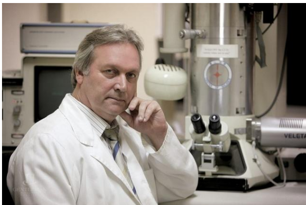
Freund Tamás

Kutatási terület: az agykéreg szerkezete, működése, oszcillációk keletkezése, funkciója, az epilepsziás és ischaemiás agykárosodás, a szorongás és az addikció patomechanizmusa, az endokannabinoid szignálrendszer működése