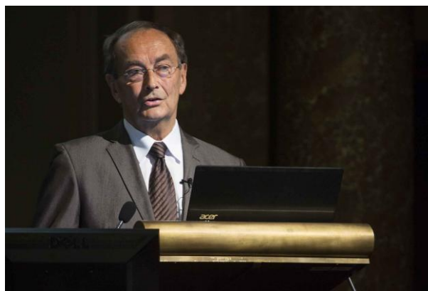
Kosztolányi György