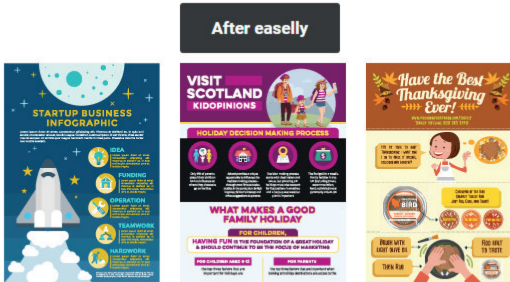
1. ábra Az infografika-sablonok egyik gyűjteménye