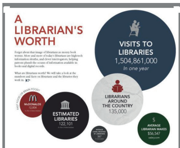
3. ábra A könyvtárak értéke, helye a világban