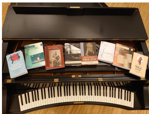
A 20–21. Századi Magyar Zenei Archívum új kötetei Dohnányi Ernő zongoráján

A monográfiákat Tallián Tibor , az MTA levelező tagja mutatta be a Magyar Tudomány Ünnepe alkalmából az MTA I. Osztálya által szervezett ünnepi online ülésen.