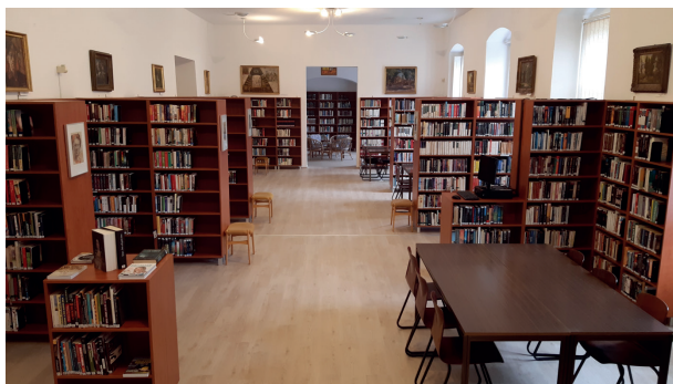
A szépirodalmi részleg

A felhasználói igények változásával párhuzamosan alakítjuk a könyvtár szolgáltatási rendszerét és folyamatosan fejlesztjük a technikai feltételeket. Tapasztalataink szerint az olvasás nem megy ki a divatból , viszont míg régebben elsősorban az ismeretszerzés, tanulás eszköze volt a könyv, ma inkább a kapcsolódásnál van nagyobb szerepe. Könyvbeszerzési politikánkat tehát úgy alakítottuk ki, hogy igyekszünk a legfrissebb, közkedvelt könyveket gyorsan, a helyi könyvesboltból beszerezni, olvasóink konkrét kéréseit is teljesítve.