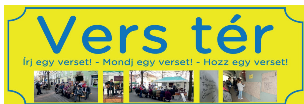
A Vers tér népszerűsítése molinón