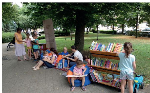
Könyvtár a játszótérekben