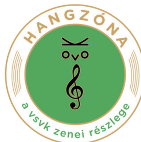
A zenei részleg új logója