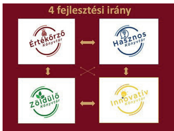
4 fejlesztési irány