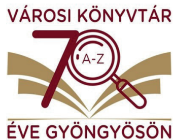
A városi könyvtár megalakulásának 70. évfordulójára