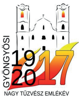
A nagy gyöngyösi tűzvész 100. évfordulójára

Több munkatársunk kreativitását bizonyítja, hogy saját magunk készítjük arculati elemeinkhez illeszkedő logóinkat, plakátjainkat.