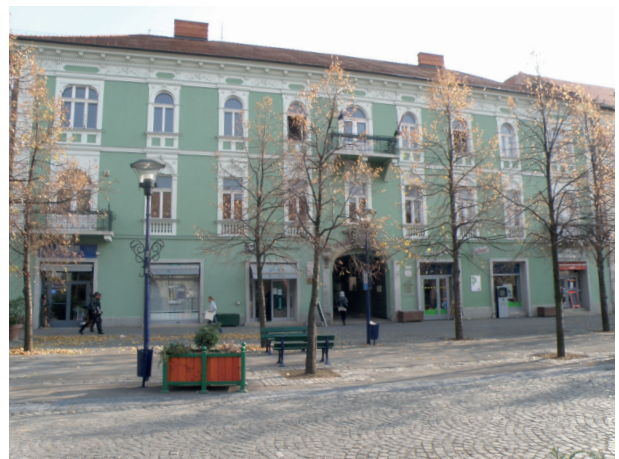
A könyvtár épülete a Fő téren

Dokumentumállományunk 100 000 kötetes, rendelkezünk egy gazdag helyismereti gyűjteménnyel, zenei részleggel, régi könyv gyűjteménnyel. A kölcsönzés mellett több szolgáltatásunkat is igénybe veszük: internethasználat, irodai eszközeink használata, bőséges újság- és folyóirat-választék, népszerű a weboldalunkon keresztül otthonról is elérhető katalógusunk, és az előjegyzési lehetőség.