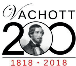
Könyvtárunk névadója születésének évfordulójára