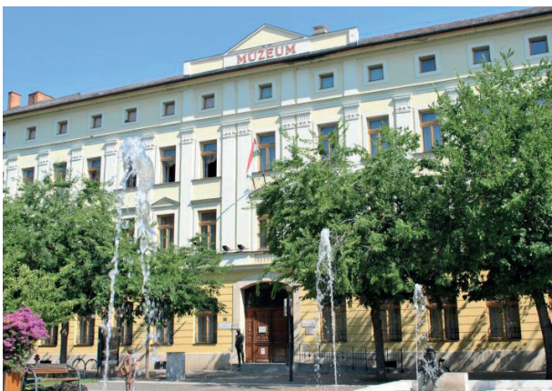
A múzeum épülete