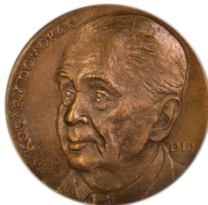
A Kosáry Domokos-díj zöld színű háttérrel 235 x 235 mm nagyságú keretdobozban elhelyezett, egyoldalas, bronzból készült, 97 mm átmérőjű érem, mely Csikai Márta Munkácsy-díjas szobrász alkotása.

Kosáry Domokost 1995-ben a Gödöllői Agrártudományi Egyetem (a MATE jogelőd intézménye) díszpolgárrá fogadta. A nevét viselő Könyvtár főbejáratánál emléktábla idézi egyik jelentős, máig érvényes gondolatát: „Az alkalom fel nem ismerésén, a tévedésen, a bizonytalanságon a legjobb szándék sem segít [...] A reális szem, a döntés és határozott cselekvés képessége viszont, akár kockázatvállalás, akár kompromisszum van soron, meg tudja sokszorozni az erőt.” - Kosáry Domokos, 1983.