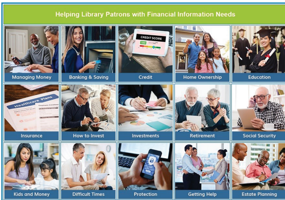
3. ábra A Smart Investing@Your Library könyvtáros továbbképzési témakinálata