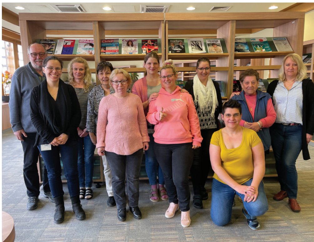
4. ábra A kollektíva