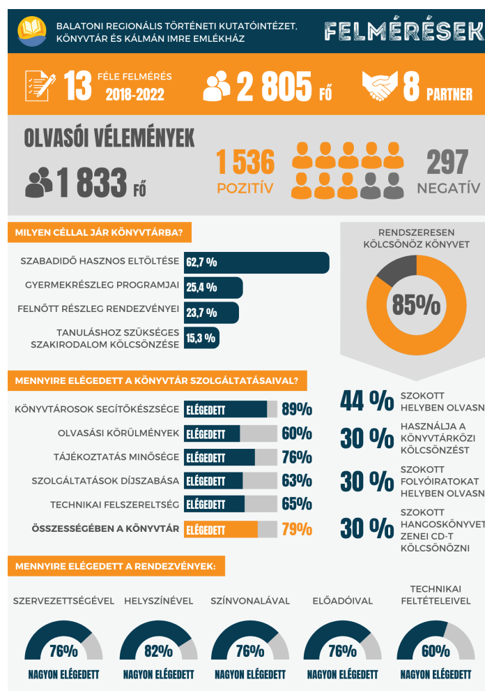
1. ábra Felmérések

retetszolgálat napközis csoportja számára, Alzheimer Café, Internet Fiesta, Vöröskereszt, Ferences Szegénygondozó Nővérek), valamint az akadálymentesítés terén.