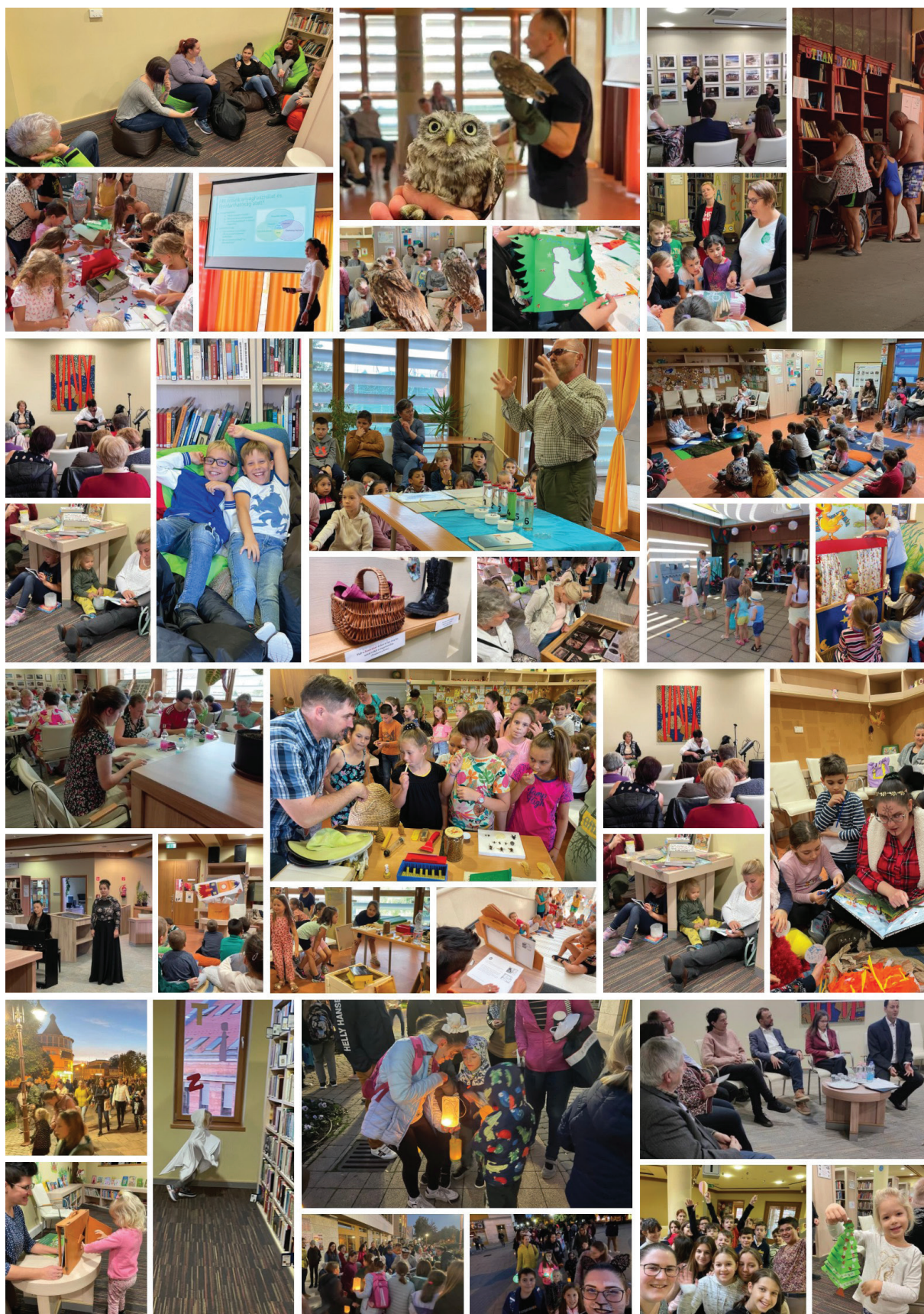
3. ábra Programok az elmúlt évről