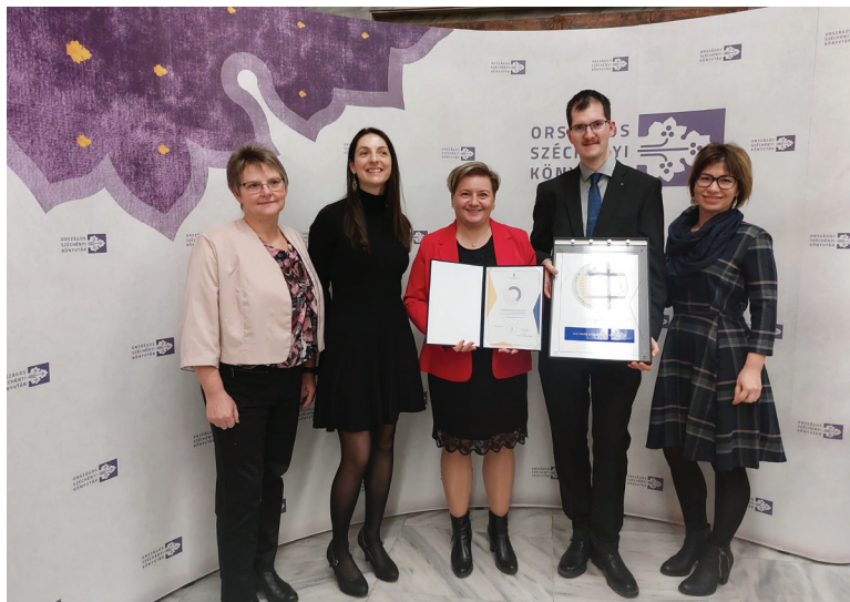
3. ábra A könyvtár lelkes csapata