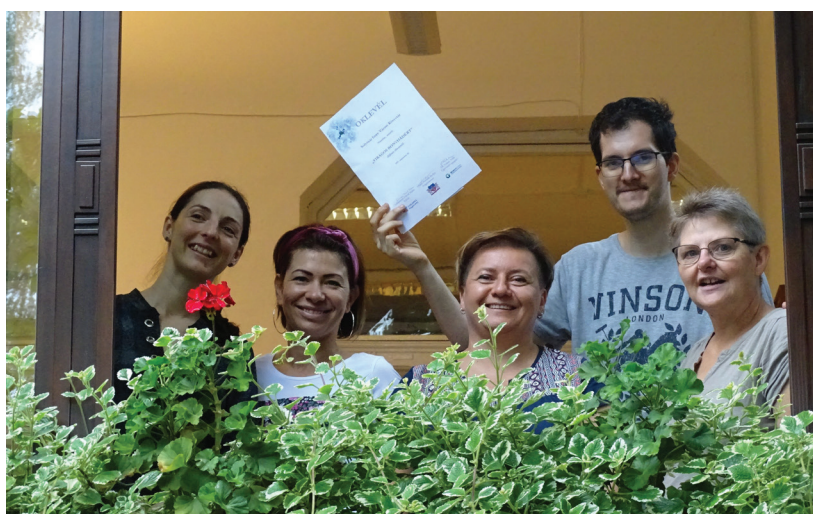
2. ábra A város virágosítása