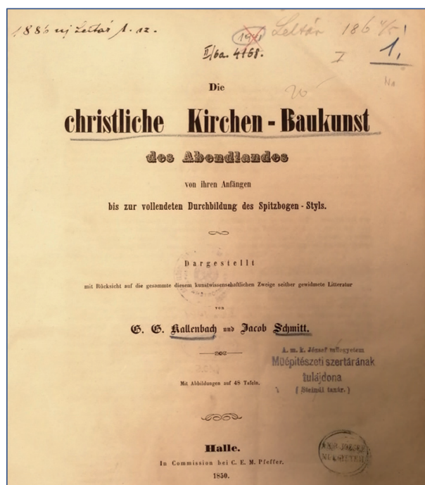
1. ábra Kallenbach, G. G., Schmitt, J. Die christliche Kirchen-Baukunst des Abendlandes von ihren Anfängen bis zur vollendeten Durchbildung des Spitzbogen , Halle, Pfeffer, 1850. Lelőhely: BME Építészettörténeti és Műemléki Tanszék, leltári szám: 6125, jelzet: M-6389

Szkalnitzky helyét a József Polytechnikumban 1870-ben vette át Steindl Imre , 15 aki a statisztikai adattár szerint maga felügyelte az 1884-ben 16 már külön helyiségben lévő könyvtárat és kezelte a könyvvásárlásra fordítandó évi 600 Ft dotációt is. 17 Az adattár összeállításához az Országos Statisztikai Hivatal kérdőíveket küldött szét az 1884. évi állapot felmérésére és feltehetően Steindl Imre szolgáltatta a felmérés kérdőívén szereplő adatokat, beleértve az alapítás évét. 18 Nagy valószínűséggel tehát Szkalnitzky volt az, aki lerakta a Műépítészet tanszék könyvtárának alapjait, Steindl pedig e kezdeti könyvtárat gyarapította tovább. A műépítészeti szertár könyvtárában a statisztika szerint 1884-ben 660 kötet, jellemzően épí-