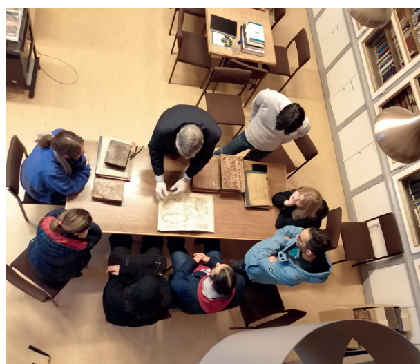
4. ábra Külföldi hallgatók Az Építészettörténet című tárgy könyvtárban tartott óráján vesznek részt

A tanszéki demonstrátorok rendszeresen vállalnak könyvtári feladatokat is, értékes munkájukkal - az állományellenőrzéstől a raktári rendezésen át a digitalizálásig - sokban hozzájárultak a könyvtár fejlődéséhez. A demonstrátoroknak sok esetben szorosabb kötődése is kialakul a könyvtárhoz, későbbi kutatásaik során magabiztosabban mozognak a már ismert közegben.