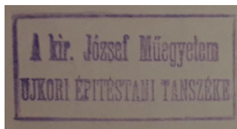
2. ábra Állománybélyegzők az Építészettörténeti és Műemléki Tanszék tulajdonában lévő dokumentumokban